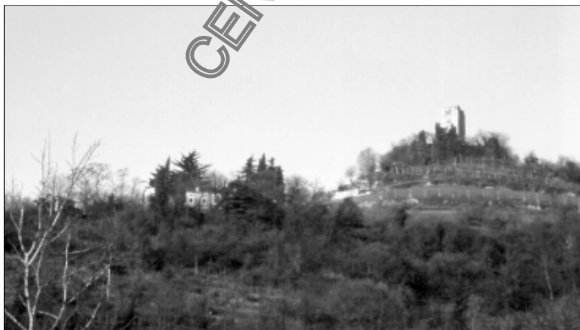
Immagine del territorio di Brendola

Cenni storici: Il territorio di Brendola, come è testimoniato dai ritrovamenti archeologici, dall'evoluzione del popolamento del vicentino fin dall'epoca protostorica, fu interessato già a partire dall'età del Bronzo da cicli di popolamento discontinui e rivolti soprattutto verso l'area collinare ma presenti anche in piano (Cà Rossa- S. Giacomo, Pila) a partire dalla metà del V sec. a.C. e sino al I sec. a. C. (periodo della romanizzazione istituzionale) si assiste alla stabilizzazione dei siti in pianura (Soastene, Triveneta, Cà Rossa). I primi contatti con i Romani risalgono per lo meno all'epoca della stesura della Via Postumia (da Aquileia a Genova nel 148 a.C.) il cui percorso nel tratto V-VI è l'attuale S.S. 11. Il processo di inserimento nello stato romano come in tutta la regione, si svolse nel corso del I sec. a.C. e culminò nel 49 a.C. e il 42 a.C. con la concessione della cittadinanza romana a Vicenza che divenne "municipium". A questa sistemazione storica seguì poi la definizione del distretto territoriale e probabilmente tutto ciò contribuì alla stabilizzazione degli insediamenti rurali esistenti e all'espansione in aree prima trascurate. I collegamenti con i centri vicini furono assicurati da una rete viaria maggiore comprendente la Postumia e la via di