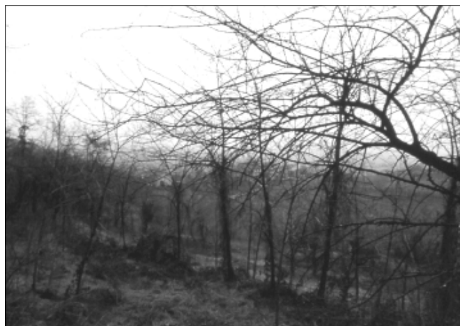
Alcune immagini del territorio di Brendola